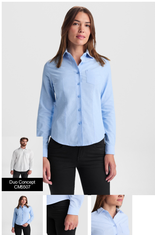
Duo Concept CM507